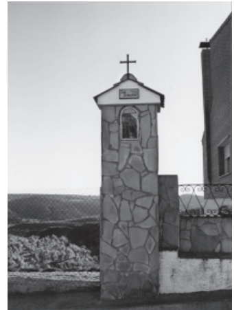
FIGURA 9: S. Sebastián, Alcampell FIGURA 10: S. Sebastián, Azanuy FIGURA 11: S. Sebastián, Castellonroy

Por otro lado, algunos pilarets son testimoniales del lugar donde existió un antiguo templo o capilla ya desaparecida. Este es el caso del pilar dedicado a la Virgen de Viverol en Tamarite, que recuerda el lugar donde se levantó un antiguo templo que se remonta a la época de la reconquista cristiana, donde se concedieron tierras, entre otros, a los monjes de Poblet, a quienes se les entregó la importante granja de Viverol 5 [fig. 12]. De ese antiguo asentamiento ha llegado a nuestros días la tradición de celebrar, el último domingo de agosto, la fiesta de la Virgen de Viverol, en el pilar que la recuerda. También el desaparecido pilar de Santa Justa en Cuatrocorz, que estaba situado junto al camino viejo de Baells, a un kilómetro y medio de distancia del pueblo, en la partida con este nombre, recogía la advocación a la que estaba dedicada una antigua ermita, de la que Pascual Madoz nos