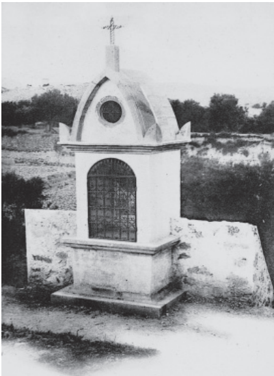
FIGURA 14: Pilaret construido en 1902 en honor a S. José de Calasanz, Peralta de la Sal

También en Peralta de la Sal, el actual monumento al olivo situado junto a la carretera de Calasanz tiene como inmediato precedente un modesto pilar [fig. 14]. La tradición afirma que en este lugar san José de Calasanz, siendo solo un niño, se enfrentó al demonio cuando decidió darle muerte por ser enemigo de Dios, y en esa empresa, armado con un cuchillo, recorrió todos los rincones de su casa desafiando en voz alta al diablo. En vista de que no lo encontraba, decidió buscarlo en el campo, acompañado de otro niño de su misma edad y de cuantos se fueron agregando, hasta llegar a un pequeño olivar donde desenvainó el puñal y en voz alta comenzó a increparlo, tratándolo de cobarde, puesto que permanecía oculto, hasta que de repente apareció como una terrible sombra en lo más alto de un olivo. El pequeño Calasanz, tomando con los dientes el puñal y valiéndose de los pies y de las manos, se encaramó al árbol y se lanzó contra el demonio para herirlo, pero la gruesa rama sobre la que estaba se desgajó bajo sus pies y el demonio desapareció. En este lugar, en 1902 fue levantado un pilaret con la imagen del santo a