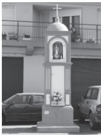
FIGURA 27: Pilar de la Inmaculada, Alcampell