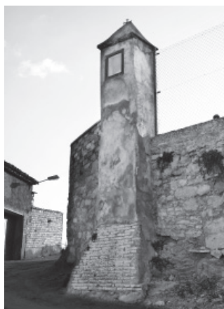
FIGURA 24: Pilaret de S. José de Calasanz, de Peralta de la Sal, en la actualidad

de ellos en 1936. Consta en este sentido la orden dada por el Comité de Albelda el día 23 de julio de 1936 de que «aterren el pilar con la imagen de San Antonio existente en la bifurcación de caminos de la Cuesta de Colet» 15 . El único pilar que se conserva completo, anterior a 1936, es el de San José de Calasanz, en Peralta de la Sal, que conserva una antigua talla del santo [figs. 22, 23, 24]. Otros aparecen citados en la toponimia local que recoge la palabra pilaret , por lo que puede suponerse que en esa zona hubo en algún tiempo un pilar del que tan solo ha perdurado el nombre. Este es el