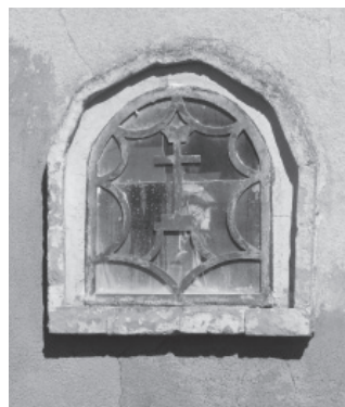
FIGURA 15: S. Roque, Esplús