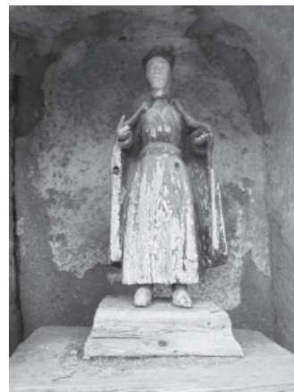
FIGURA 23: Imagen del pilaret de S. José de Calasanz, Peralta de la Sal