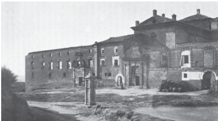
FIGURA 13: Antiguo pilar de la Virgen del Patrocinio frente a su Santuario, Tamarite

Caso contrario es el pilar de la Virgen del Patrocinio de Tamarite [fig. 13]. El primer templo desde el que se le tributó culto público fue una columna en la que se abrió un nicho donde fue colocada la imagen que encontrara el Dr. Larré en 1660, frente al actual templo del Patrocinio. El P. Faci nos dice que debido al aumento de la devoción a la Virgen que era llevada a los enfermos, se «determinó luego fabricar en un montecillo sobre la villa, y distante unas cuatro leguas, una columna o pilar para colocar allí la Santa Imagen en nicho muy decente» 8 . Se eligió ese sitio por dividirse allí tres caminos: uno conducía a Monzón, otro al Cinca y el