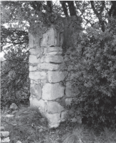
FIGURA 1: Sta. Bárbara, Calasanz

Si tratamos de buscar los antecedentes de los peirones, encontramos como todos los pueblos a lo largo de la historia, para sus ritos y ceremonias, han amontonado piedras o levantado monolitos. La misma voz peirón nos remite a la palabra pedra . En el habla de La Litera se les denomina pilarets , derivado diminutivo de pilar , procedente del latín vulgar Pilarem , pilastra o mojón, a su vez derivado de Pilam , columna 2 .