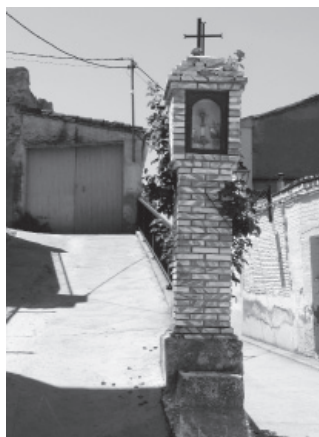
FIGURA 26: V. del Pilar, Azanuy