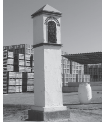
FIGURA 12: Virgen de Viverol, Tamarite

dice que en 1848 estaba ya casi arruinada 6 y que se edificó en el lugar que ocupaba la antigua iglesia de Santa Coloma de Montmagastre, que fue librada el año 1103 por el obispo de Roda Ponce al monasterio de Santa María de Alaón como dote de la iglesia de San Bartolomé de Calasanz, junto con los derechos que tenía sobre las iglesias de Montmagastre 7 . Juan de Segura, en su Discurso de la Fundación y Estado de la Real Casa de Montearagón , obra publicada en Huesca en 1619, escribió que «en el monte que separa los términos de Peralta, Cuatrocorz y Baells, hubo una ermita de Santa Justa, nombre que aún conserva dicho monte, y que fue el lugar donde se fundó el Monasterio que dio lugar a Montearagón».