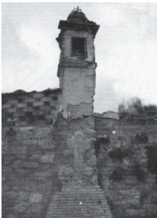
FIGURA 22: Vista antigua del pilaret de Peralta de la Sal

Los pilares que en la actualidad se conservan en la comarca de La Litera fueron reconstruidos durante la segunda mitad del siglo XX al haber sido derruidos muchos