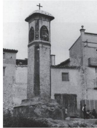
FIGURA 21: Antiguo pilaret de S. Antón, Castillonroy

Esta devoción ha llegado hasta nuestros días, y se mantiene en la totalidad de los municipios la tradición de festejar a los titulares a los pies del pilar. La víspera de su festividad se suele encender una hoguera donde se reúne el vecindario y se rezan rosarios o se celebra el sacrificio de la misa en su honor. Tradiciones más antiguas nos hablan del reparto del pan de caridad a los asistentes, como en Castillonroy, donde las casas de Borrás y de Saura, que levantaron el pilaret en honor a san Antonio Abad, repartían esta caridad, entonces muy apreciada [fig. 21].