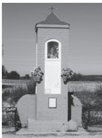
FIGURA 25: S. José, Alcampell