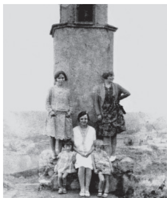
FIGURA 17: Primer pilaret de S. Sebastián, Castillonroy