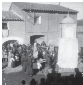
FIGURA 16: Acto religioso celebrado en honor de la Virgen de la Inmaculada en su pilaret de Alcampel