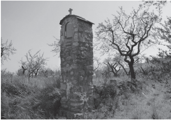
FIGURA 28: S. Francisco de Asís, Calasanz

Aunque sean por lo general modestos en apariencia, los peirones son parte importante del patrimonio cultural de Aragón por su constante presencia en el paisaje de la comunidad y por ser testimonio de numerosas tradiciones que, debido al modo de vida actual, tienden a desaparecer. Por todo esto, la Ley 3/1999 de Patrimonio Cultural Aragonés, en su disposición adicional segunda, recoge la declaración genérica como Bien de Interés Cultural por ministerio de ley para todos los peirones existentes en Aragón [figs. 25, 26, 27 y 28].