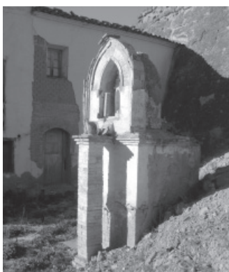
FIGURA 18: Pilaret de la Virgen Milagrosa, Albelda