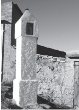
FIGURA 20: S. Roque, Baells