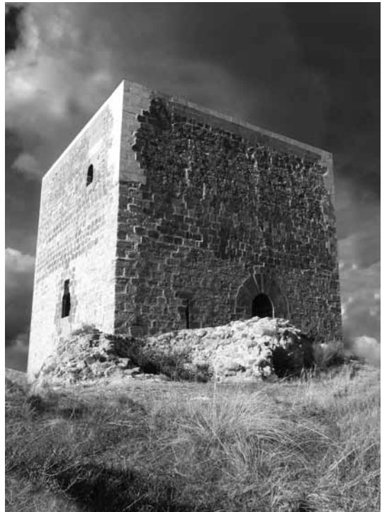
FIGURA 2: La gran torre de planta rectangular

Tot aquest context històric serveix per veure la rellevància d'aquest castell des de l'època musulmana fins a gairebé els nostres dies. Certament, es tracta d'un punt clau dins la història de la Llitera. La seva monumentalitat, encara ara, demostra d'una manera visual i directa la seva importància. L'edifici en si, i totes les altres estructures que l'envolten, són testimoni directe d'unes accions passades pensades i fetes per l'home. Com a tal, s'han de considerar restes arqueològiques, que ajudaran a complementar i millorar el discurs històric ja formulat, i per això és necessari interpretar-les correctament.