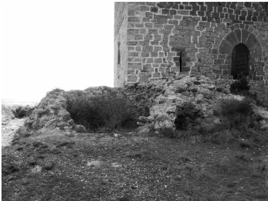
FIGURA 4: Restes de la probable torre islàmica davant la torrassa