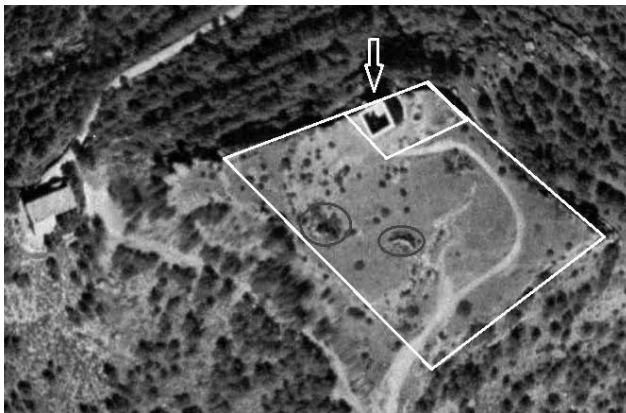
FIGURA 3: Vista aèria del conjunt de la fortificació

A través de la figura 3 es poden observar les diverses estructures descrites més amunt. Cal destacar, a l'esquerra, l'ermita de la Verge de la Mora a un nivell inferior i d'època posterior i el marcat camí per accedir a la fortificació. El recinte amb forma trapezoïdal és el jussà . Els cercles corresponen a dues estructures: la de més cap a l'esquerra és la cisterna ja esmentada i la de la dreta són les restes de la capçalera de l'antiga ermita de Sant Julià de Montmegastre. Aquesta última és la que es pot apreciar millor dins la vista. En canvi, la cisterna a la base el·lipsoïdal no es poden apreciar gaire bé. Assenyalat amb una fletxa i emmarcat amb un quadrat apareix el recinte sobirà . D'esquerra a dreta es pot identificar la base quadrada de la torrassa. Al seu costat s'aprecia la base de la torre cilíndrica, probablement d'origen islàmic. Finalment, la línia que tanca aquest últim recinte es correspon amb les restes de mur en millor estat de conservació.