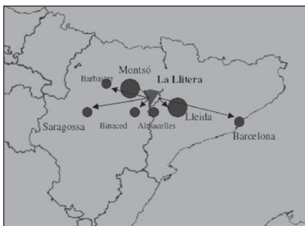
Mapa 1: Principals destins de la mobilitat per treball a fora de la Llitera (2001)

El mapa 1 i la taula 2 sintetitzen les principals destinacions de les persones ocupades de la Llitera que habitualment treballen a fora de la comarca. Lleida i Montsó són els llocs que atrauen més gent (entre les dues localitats, atrauen quasi la quarta part dels ocupats que marxen), seguits a distància per Binaced i Barcelona, així com per Barbastre, Saragossa i Almacelles amb uns percentatges ja molt més minoritaris.