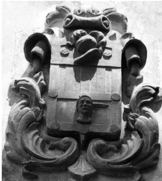
Escudo en piedra de los Zaydín de Tamarite.