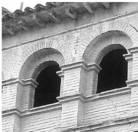
Arquillos de la Casa solariega de los Valonga.

Al llegar el Trienio Liberal, ya fuese por sus convicciones, ya fuese por el parentesco estrecho con el Barón de Eroles, o por ambas cosas, la Regencia de Urgel le nombró Corregidor de Benabarre (1822). Según decía el interesado más tarde, en aquella época era "tan amante del Rey Nuestro Señor y del Antiguo Regimen monarquico como