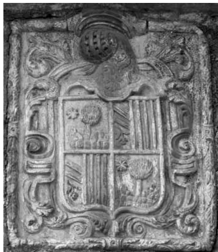
Piedra armera de Casa Valonga, en Azanuy.

opuesto a la Constitución y revoluciones de las Cortes". Por esa razón tanto él como su familia, que intentó refugiarse en Estopiñán, fueron perseguidos por las tropas liberales y tuvieron que esconderse en los Pirineos, huyendo de pueblo en pueblo.