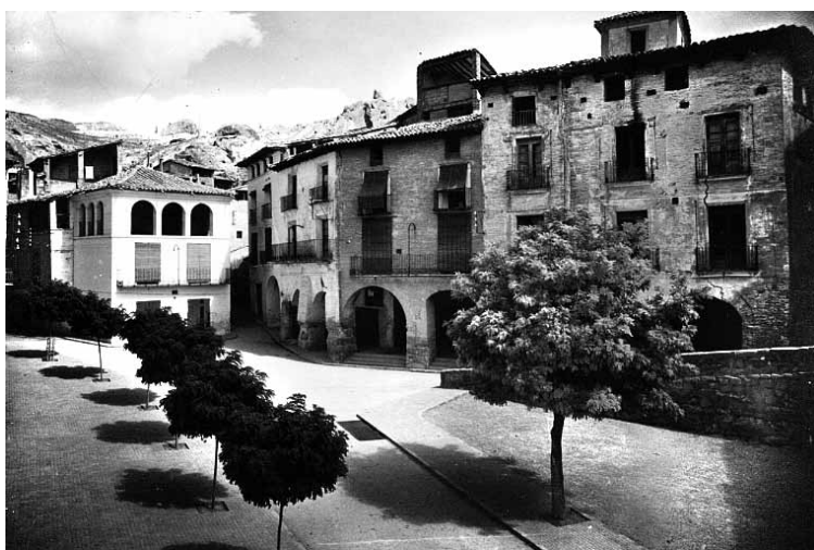
Plaza Mayor de Tamarite con la Casa de los Tudor a la derecha.

Seguramente fue el "servicio" de 40.000 reales al erario público, que era el arancel ordinario, más otros 10.000 de propina que Tudor añadía espontáneamente "en atención a las actuales circunstancias del Estado", lo que acabó de "inclinarse y mover" el ánimo del rey para concederle a don Joaquín lo que pedía, "por vía de gracia" ya que no se podía demostrar la infanzonía con arreglo a los fueros y leyes de Aragón.