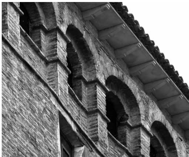
Galería renacentista de Casa Queraltó.