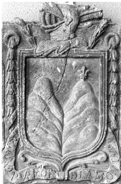
Piedra armera de Casa Purroy de Tamarite. (Museo Provincial de Zaragoza)

Sobre las circunstancias de su muerte no sabemos nada más que lo que dice una nota escueta, recogida por mosén Viola, la cual nos informa que "... habiendo padecido mucho con el trato inhumano que le daban, y últimamente le quitaron la vida, afusilándole cerca de esta ciudad, siendo la causa de todo esto su firme adhesión a la justa causa del Altar y del Trono".