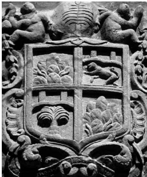
Armas de los Puch de Tamarite y Laluenga. Piedra armera en Laluenga.