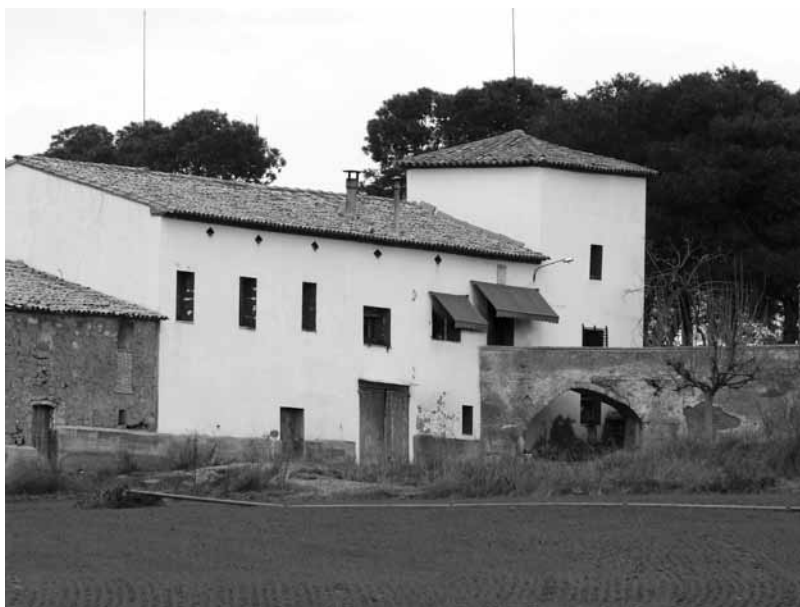
Torre Piniés en el vedado de la Malenta, cerca de Algayón, Tamarite.