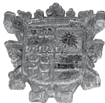
Escudo de los Lorente en la Colegial de Tamarite.