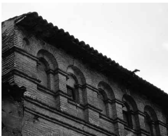
Galería de arquillos de la desaparecida Casa Lasierra.