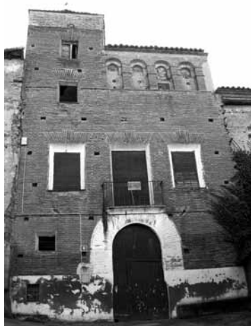
Casa Larroya, actualmente desaparecida.