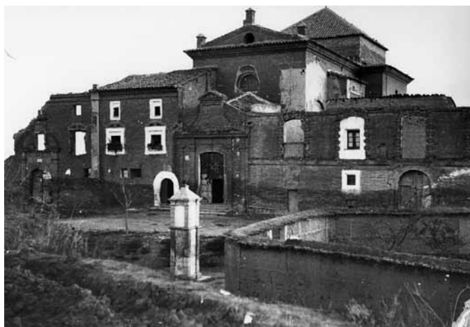
Vista general del Monasterio del Patrocinio de Tamarite de Litera, obra del siglo XVIII.