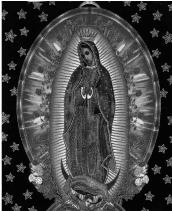
Imagen de la Virgen de Guadalupe, otra gran devoción de José Codallós.