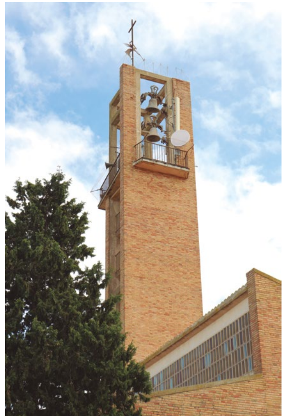
Figura 126: Detalle del campanario