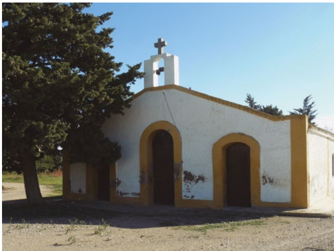
Figura 105: La ermita de Las Puebas