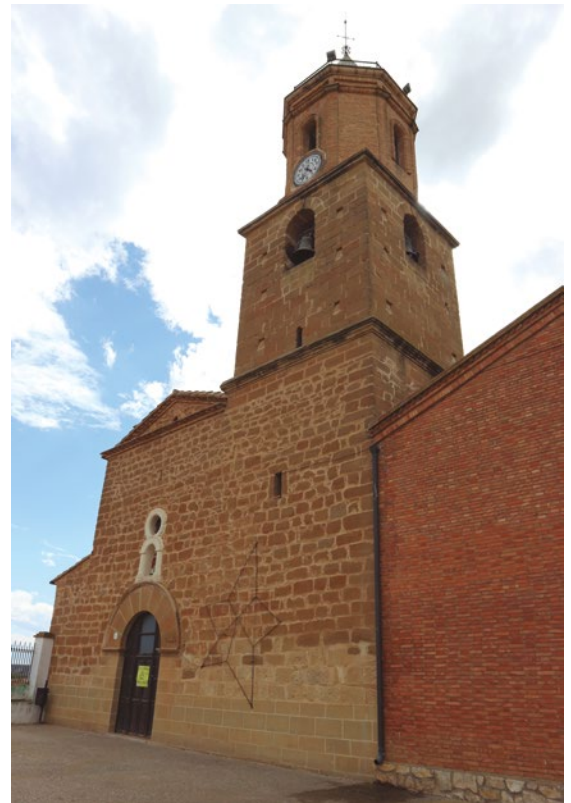
Figura 103: Campanario de la iglesia parroquial

La torre tiene una primera escalera interior que permite acceder hasta la sala de las campanas y desde donde, por una segunda, se sube al tercer cuerpo. En la sala está la matraca y dos de las campanas: Virgen del Pilar (Menezo, 1944) y la Grande o Vicenta María Pilar (Fernando Villanueva, 1952). Cuentan con yugos de hierro que se deberían cambiar por otros de madera. [fig.103]