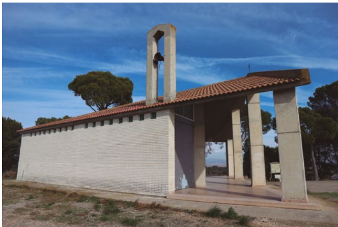
Figura 104: La espadaña

La capilla de Santa María, de Ráfales, tiene una simple espadaña, situada sobre su cubierta a dos aguas, de un único vano de arco rebajado y remate a doble vertiente. Construida probablemente a mediados del siglo xx, presenta junto a la puerta de acceso un panel cerámico dedicado a Santa María, obra de los ceramistas oscenses José María Lacoma y Elena Luis.