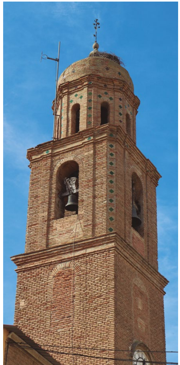
Figura 101: Detalle de los cuerpos superiores del campanario

Tiene dos campanas, denominadas Pequeña (anónima, 1878) y Grande (Francisco Martrus, 1783). Ambas conservan los antiguos yugos de madera que se deberían restaurar y conservar, puesto que su valor patrimonial es alto.