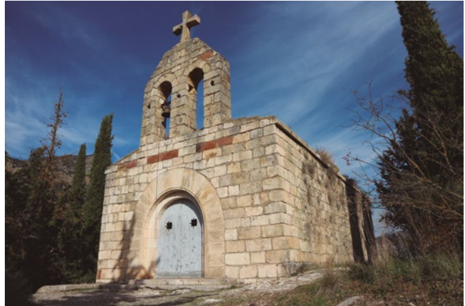
Figura 102: Vista de la ermita

XX. El conjunto pétreo está coronado por un frontón y una cruz. Su campana parece que fue fundida por Buenaventura Pallés y Armengol en 1880. [fig.102]