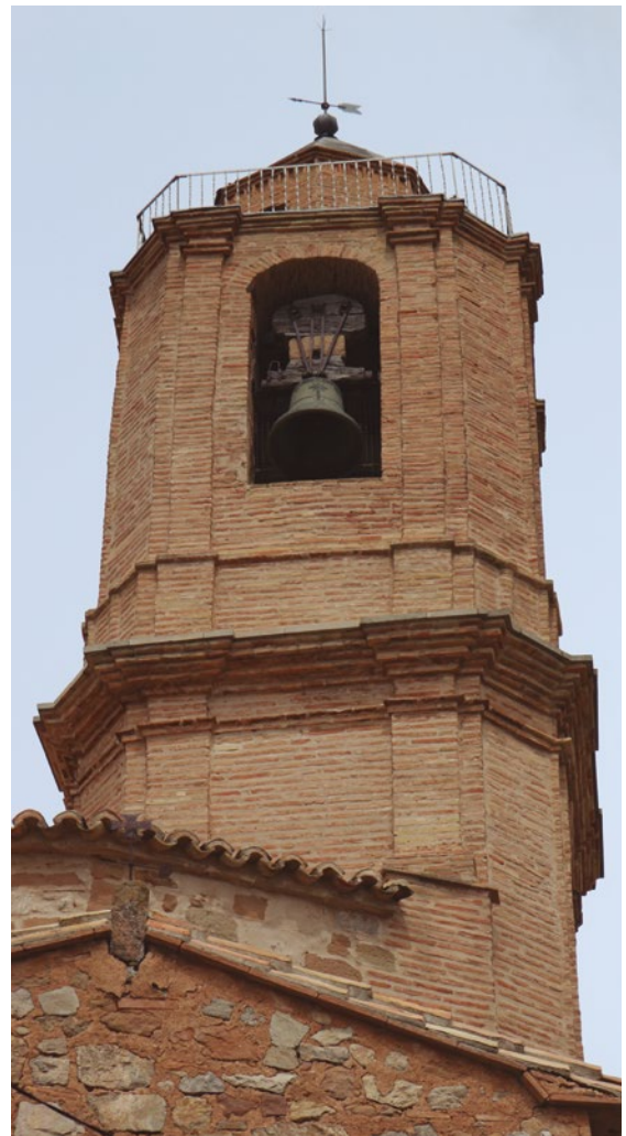
Figura 89: Campanario de la iglesia de Nachá

El acceso al campanario se realiza actualmente por la antigua cripta de la iglesia. Posiblemente era exterior en época más