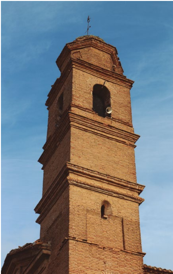
Figura 86: El campanario

Tiene tres cuerpos contruidos con ladrillo y la planta es cuadrada. El primer cuerpo sobresale por el lateral de la iglesia y tiene dos tramos separados por una cornisa. El segundo cuerpo tiene cuatro vanos con arco de medio punto, sin elementos decorativos exteriores. El tercer cuerpo