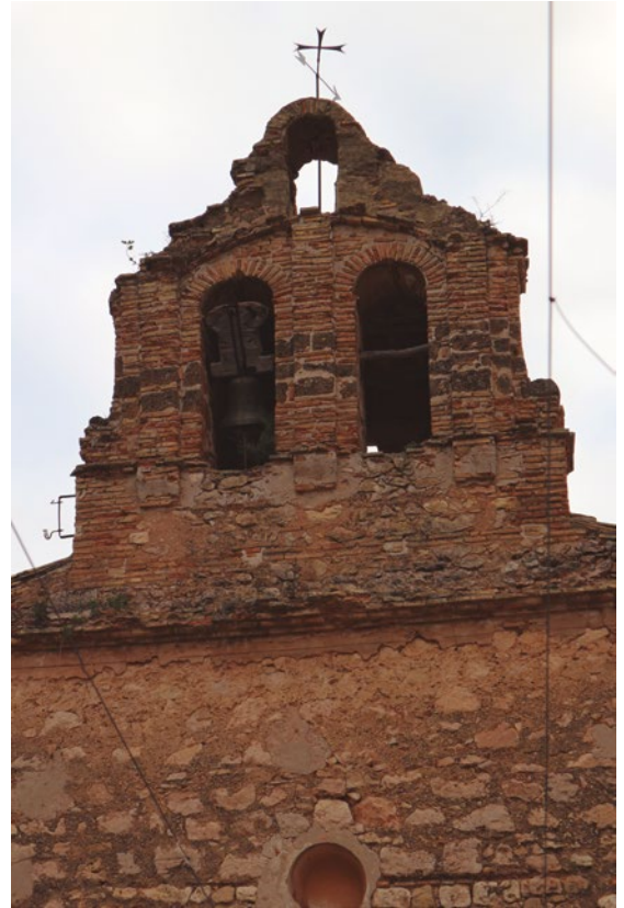
Figura 90: Detalle de la espadaña de la iglesia de San Pedro de Zurita

El acceso se realiza por el coro y las bóvedas de la iglesia. En uno de los vanos del primer cuerpo está la campana, fundida