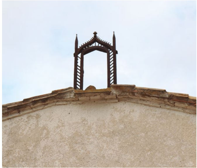
Figura 88: Detalle de la espadaña

Tiene una campana, la única que no fue destruida en 1936. Fue fundida por Ventura Manzana en 1804 y conserva la instalación tradicional, que debería restaurarse sin cambiar el importante yugo de madera. [fig.86 y 87]