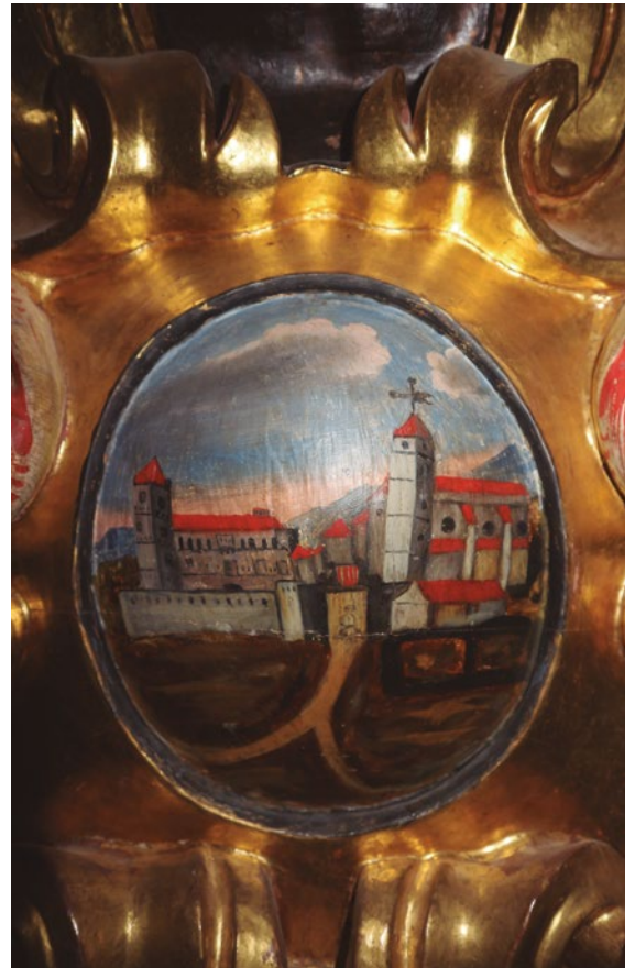
Figura 87: Representación de Baells con el campanario en el retablo mayor (1694)