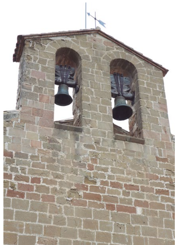
Figura 82: Vista de la espadaña

Ambas campanas conservan los antiguos yugos de madera que se deberían restau-