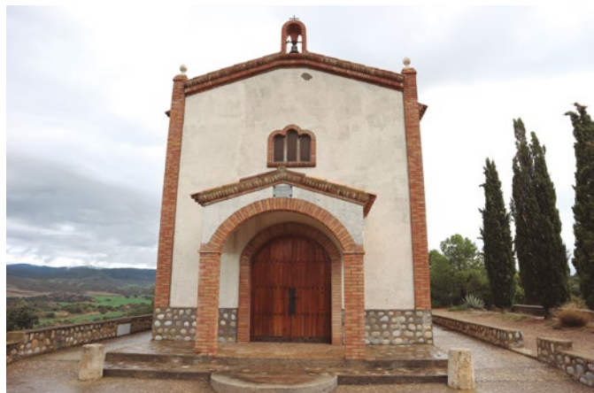
Figura 85: La ermita