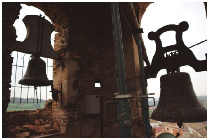
Figura 84: Campanas grande y pequeña