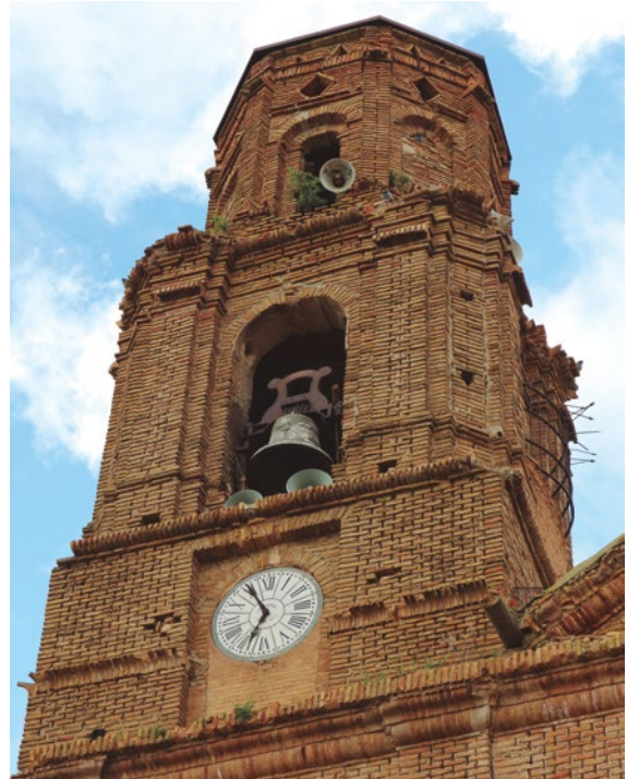
Figura 83: Detalle del campanario

La ermita está situada en una colina próxima a la localidad y en la parte más alta de su fachada principal tiene una pequeña espadaña, formada por un arco de ladrillo de medio punto. La campana fue refundida en 2004 por Hermanos Portilla. [fig.85]