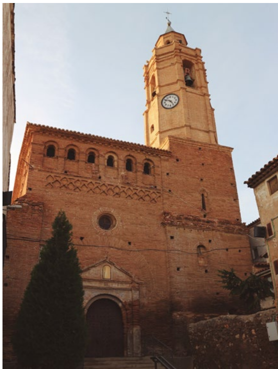
Figura 76: El campanario y la iglesia

Cuenta con cuatro campanas. La pequeña fue fundida en 1921, posiblemente obra de Vicente Domingo Roses de Valencia. Las dedicadas a santa Bárbara y santa Margarita fueron fundidas en 1944 por los Menezo de Barbastro, mientras que la orientada hacia la fachada principal se fundió en el año 2000 y está dedicada a la Virgen del Carmen. [fig. 76 y 77]