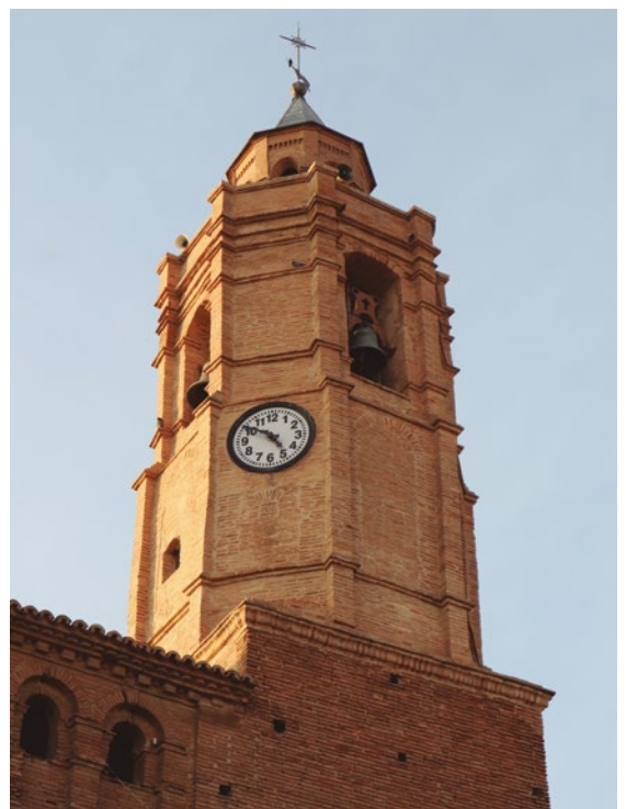
Figura 77: Detalle del segundo y tercer cuerpo