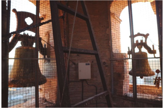
Figura 78: Campanas 2 y 4 de la parroquia

Ambas construcciones están dedicadas a santa Ana. La primera es de origen románico y sobre su fachada principal se levantó una espadaña con un arco de medio punto, seguramente un añadido posterior. En 1983 se construyó la ermita nueva con otra espadaña, aunque sin campana. [fig.79]