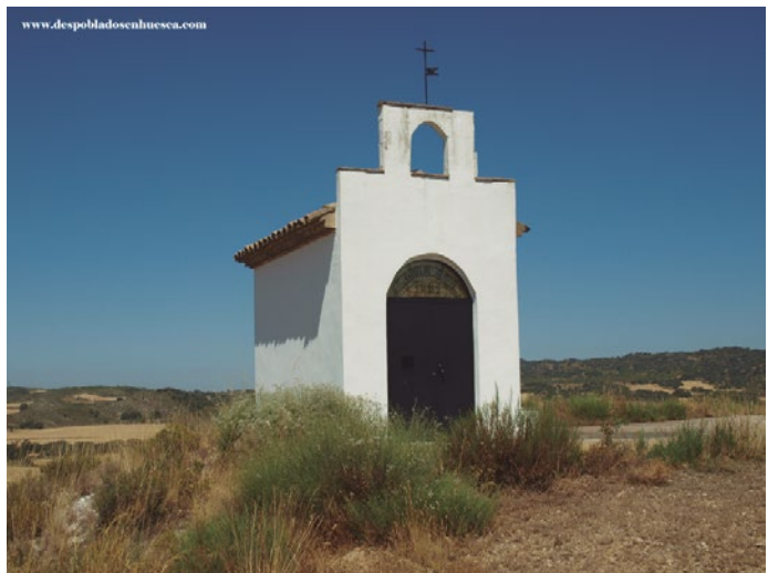
Figura 79b: La antigua iglesia y la ermita.