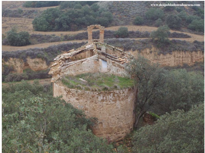
Figura 79a: La antigua iglesia y la ermita.