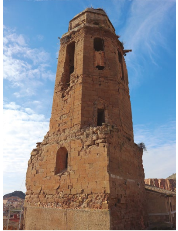
Figura 74: Vista del campanario