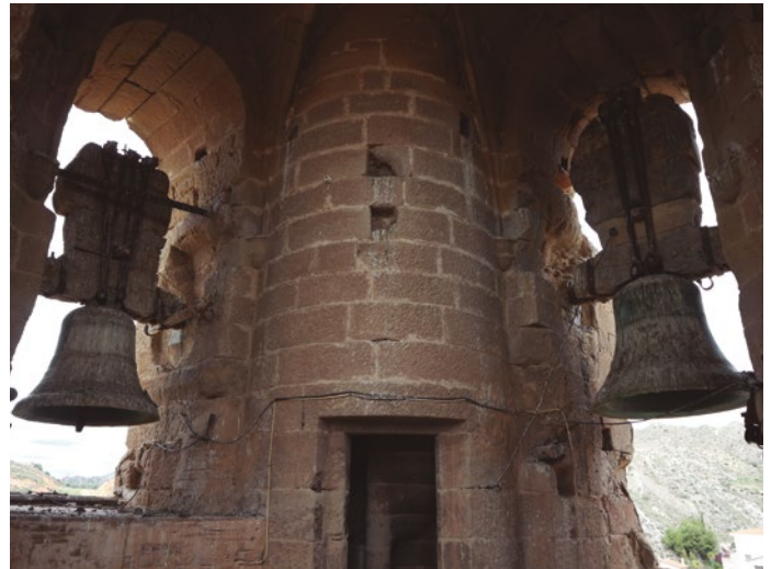
Figura 72: Sala de campanas

Esta estancia tiene siete vanos y algunos de ellos fueron tapiados antiguamente, seguramente para mejorar la expansión del sonido de las campanas. El espacio del octavo vano está ocupado por la escalera y la sala se cubre con bóveda de crucería. El tercer cuerpo es un chapitel, también de forma octogonal, que está cubierto por una sencilla bóveda también de piedra. [fig.72]