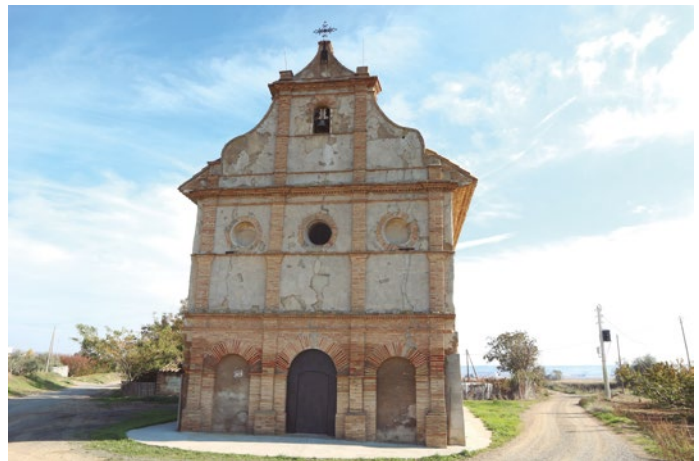
Figura 75: La ermita

Tiene una sencilla espadaña formada por un vano inserto en la parte más alta de la fachada principal. Es un sencillo vano que alberga la campana, dedicada al titular y fundida en el año 2007 por Campanas Quintana. [fig.75]