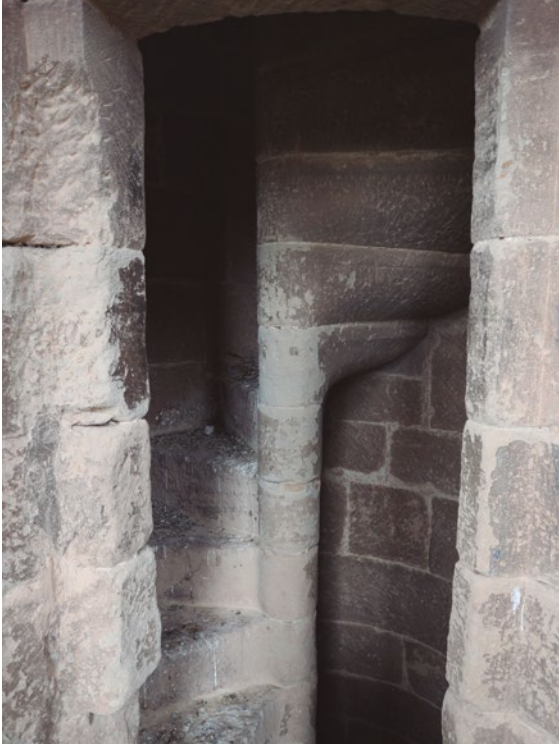
Figura 73: Escalera de caracol