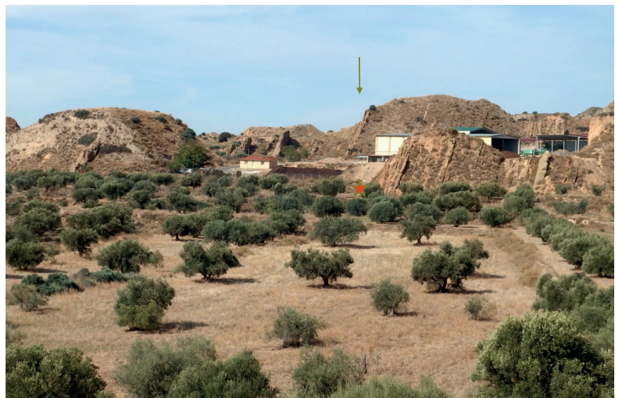
Figura 31: Entorn de la coma del Bep II (Albelda) des de l'est, en primer terme a la dreta

El conjunt dels materials ceràmics recollits superficialment amb formes i decoracions recognoscibles l'integren alguns fragments de tenalles ovoides o globulars de mides grans i mitjanes, en alguns casos amb el coll estrangulat i vores exvasades amb els llavis arrodonits, les superfícies externes i internes de colors negre o marró, allisades o rugoses, amb un cordó aplicat de desenvolupament horitzontal situat al mateix coll o a la part externa del llavi, o a la mateixa vora decorat per impressions digitals o obliqües, o amb dos cordons horitzontals paral·lels entre si, amb el superior decorat per impressions digitals i l'inferior per impressions obliqües, o per diversos cordons horitzontals decorats per impressions digitals. Un altre grup està format per fragments ceràmics de tenalles de perfil troncocònic