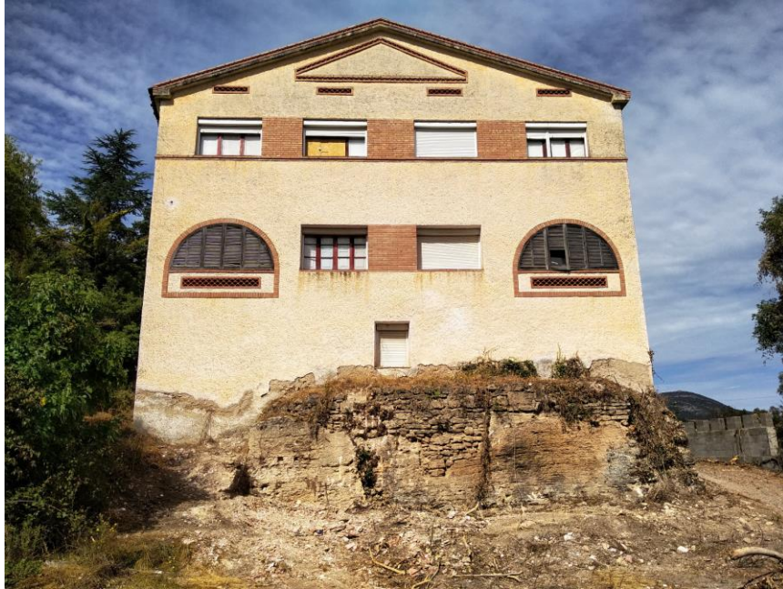
Antigua fábrica de porcelana de Camporrells, sobre roca de travertinos o “Tosca”

A continuación, descendimos por el barranco del río Pedriza llamado “ Lo Barranc Fondo ”, un magnífico paraje con un microclima muy singular, hicimos una parada al lado del barranco para ver la “ Font de dalt ” y a continuación otra a la “ Font de Ferri ”.