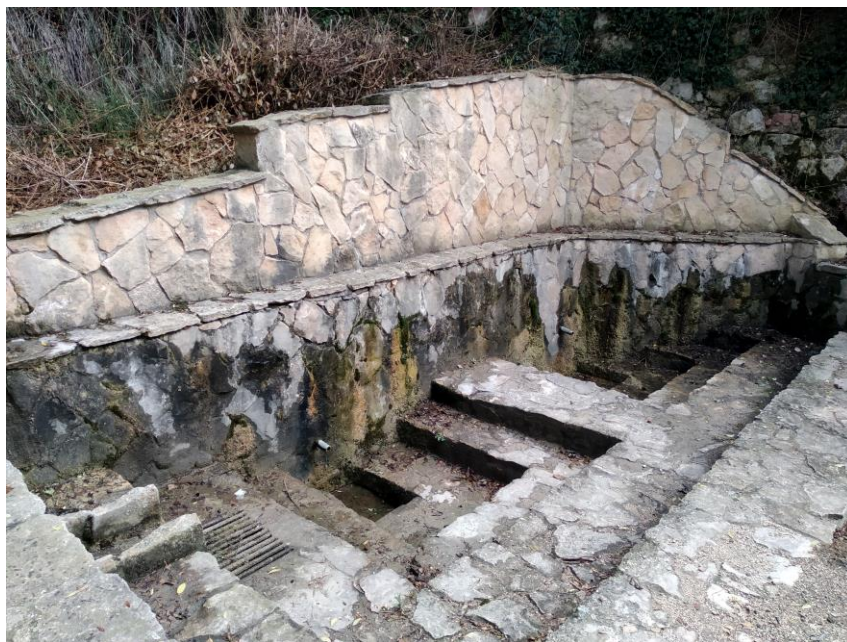
“Font de Ferri”

A continuación, descendimos por el barranco del río Pedriza llamado “ Lo Barranc Fondo ”, un magnífico paraje con un microclima muy singular, hicimos una parada al lado del barranco para ver la “ Font de dalt ” y a continuación otra a la “ Font de Ferri ”.